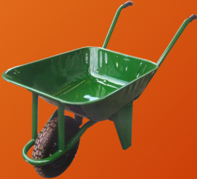
SAC AYAKLI 2