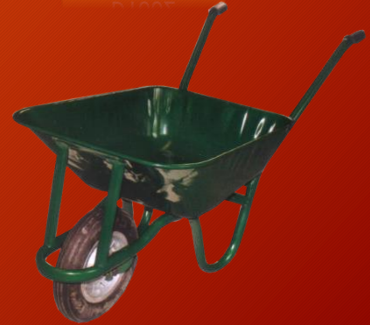
BORU AYAKLI 2